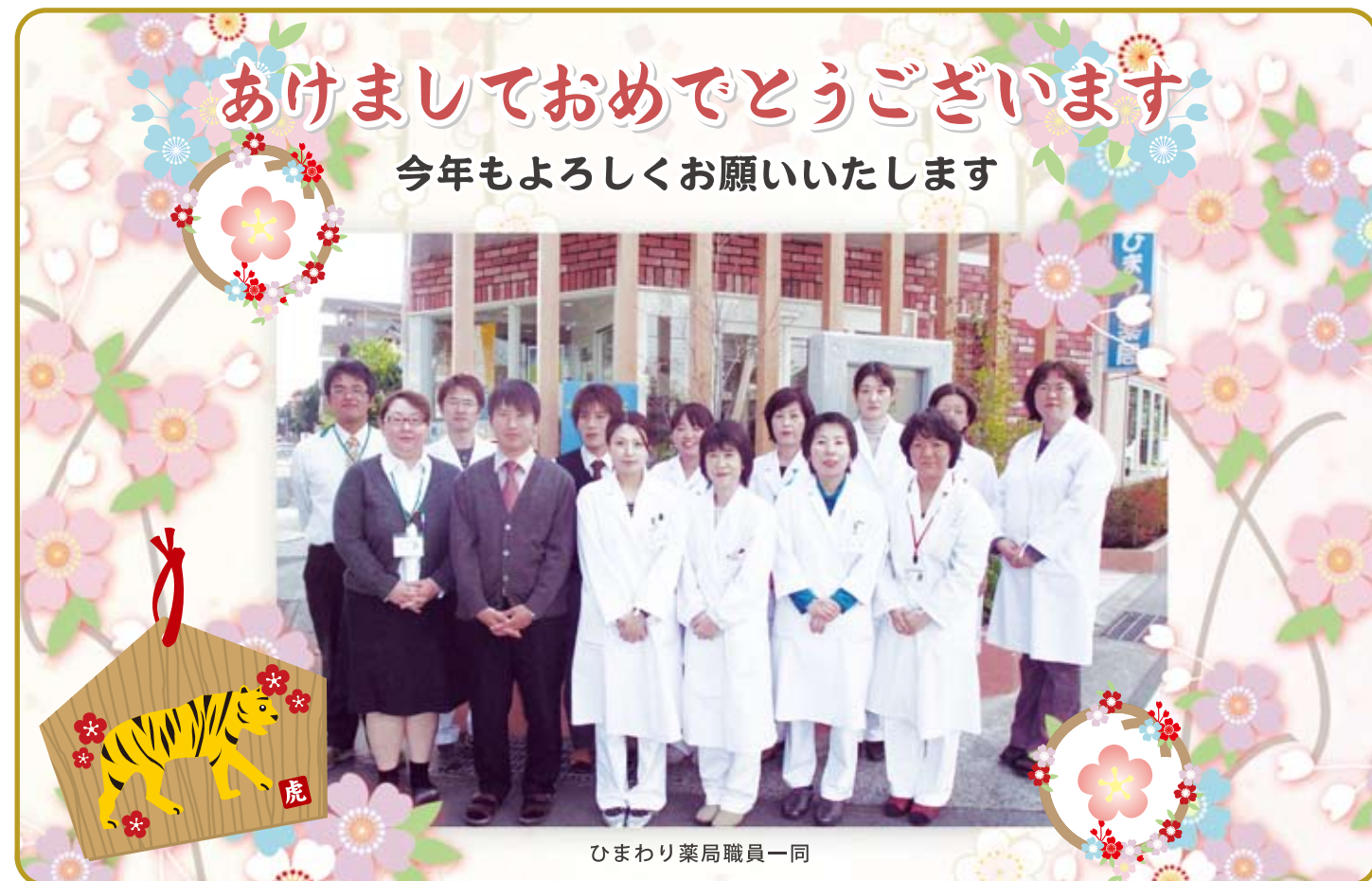
ひまわり薬局職員一同