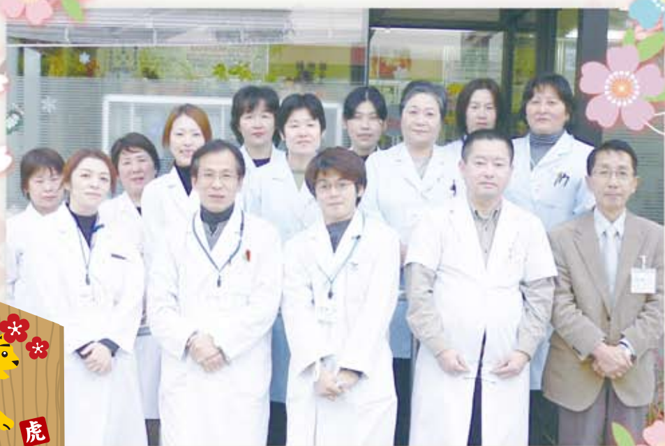
さくら薬局職員一同